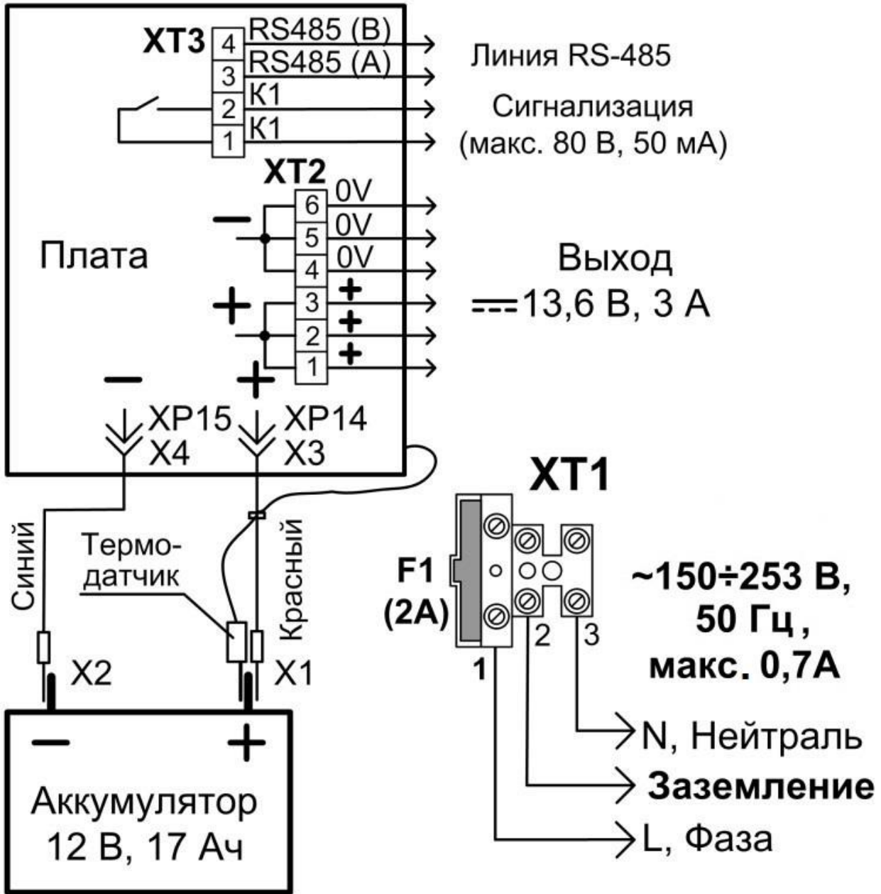
Схема подключения РИП