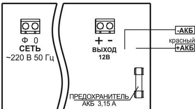
Рисунок 2 — схема подключения.