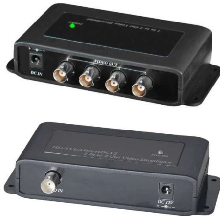
Рис.1 CD104HD (внешний вид)