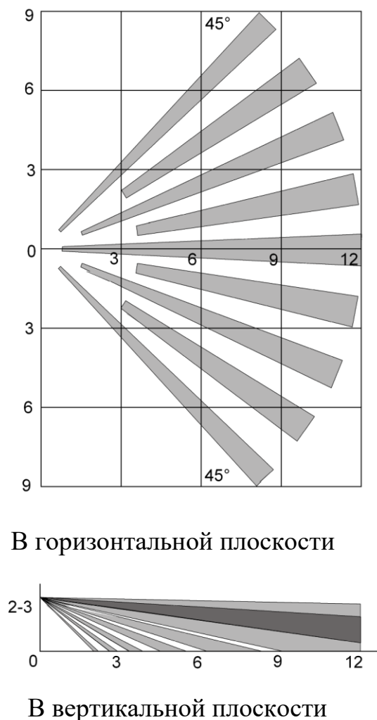
Рисунок 2.1 Зоны обнаружения извещателя "СПК-ИК"

2.1 Структура зон обнаружения извещателя приведена на рисунках 2.1 и 2.2.